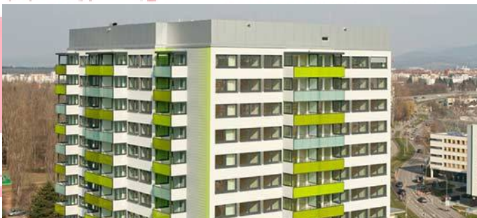
Ενεργειακά αυτόνομη πολυκατοικία, Freiburg, Γερμανία Κατασκευάστηκε: 1968 Ανακαινίστηκε: 2010 Αρχιτέκτονας: Freiburger Stadtbau GmbH (FSB)