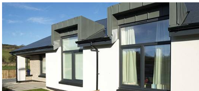
Οικισμός Bungalows, Millport, Σκωτία Κατασκευάστηκε: 2014 Αρχιτέκτονας: Anderson Bell & Christie