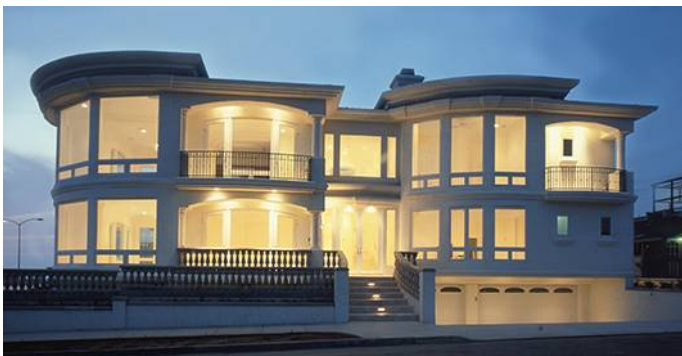
Πολυτελής κατοικία Highway 101, San Diego, Η.Π.Α. Κατασκευάστηκε: 2002 Αρχιτέκτονας: Scott Grunst