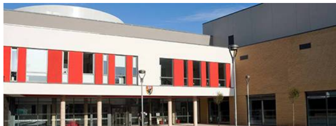
Διεθνής ακαδημία Yate, Ηνωμένο Βασίλειο Κατασκευάστηκε: 2012 Αρχιτέκτονας: Aedas Architects

* Σε όλα τα έργα αναφοράς αυτού του εντύπου έχει χρησιμοποιηθεί ως κύριο σύστημα κουφωμάτων το EURO-80 ή ισοδύναμο, συχνά συνδυαστικά με κάποιο άλλο ως δευτερεύον.