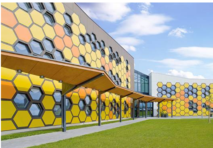
Κέντρο Επαγγελματικής Κατάρτισης Abbildung, Valga, Εσθονία Κατασκευάστηκε: 2012 Αρχιτέκτονας: Sirkel & Mall