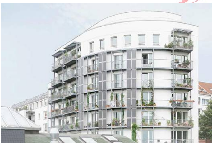
Συγκρότημα Pinnasberg, Αμβούργο, Γερμανία Κατασκευάστηκε: 2003 Αρχιτέκτονας: Joachim Reinig