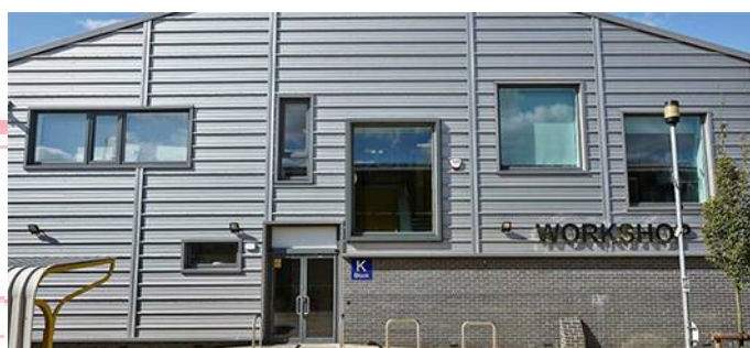
Κολεγιακό εργαστήριο, Cambridge, Ηνωμένο Βασίλειο Κατασκευάστηκε: 2014